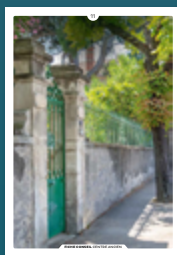
11 les clôtures

Chaque intervention sur les façades de nos centres anciens compte et participe à l'harmonie du paysage urbain. Au cœur de nos villes et villages, l'intérêt particulier et l'intérêt général doivent être conjugués pour créer le cadre de vie que nous y recherchons tous.